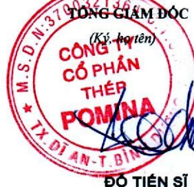
ĐỖ TIẾN SĨ